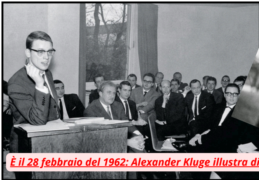
È il 28 febbraio del 1962: Alexander Kluge illustra di Manifesto contro il "cinema di papà"