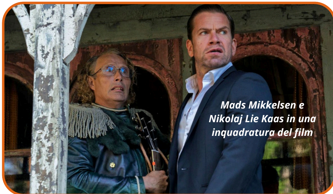
Mads Mikkelsen e Nikolaj Lie Kaas in una inquadratura del film